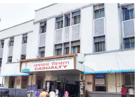
हिंदू प्रकाशवार्ता। प्रतिनिधी

अधिष्ठात्यांवर मनमानी कारभाराचे आरोप; लाड-पागे समितीच्या नियुक्त्यांवरून संताप